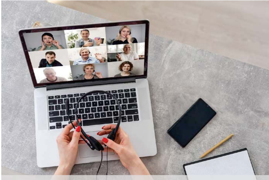
Das Büro zuhause wird vom Staat gefördert.